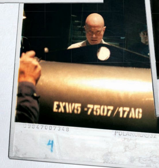
Elizabeth Debicki (arriba) interpreta a la villana de la historia: Victoria Vinciguerra es la mujer de un nazi que pretende usar todos sus recursos para construir su propia arma nuclear. El elenco incluye a Luca Calvani, Hugh Grant y Christian Berkel.