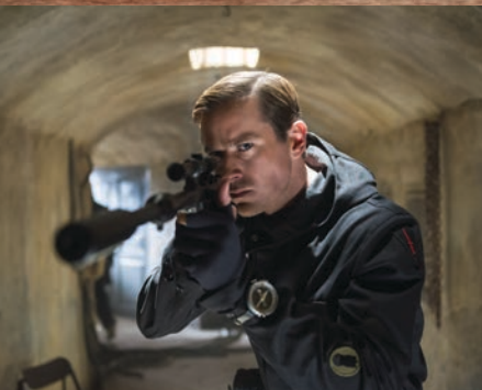
La historia inicia un año después de la Crisis de los Misiles de Cuba, que casi provoca una guerra nuclear en 1962.

de dinero apostadas en individuos. Es como ver los juegos olímpicos en esteroides [ríe]. AH: Kuryakin y Solo son dos tipos que se ven obligados a trabajar juntos.