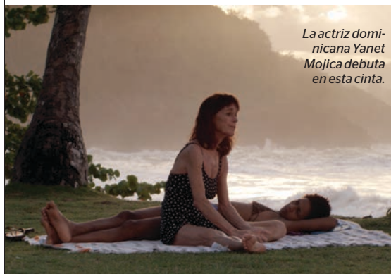
La actriz dominicana Yanet Mojica debuta en esta cinta.