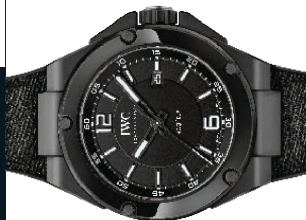
Ingenieur Automatic AMG Black Series Ceramic Automático, 46 mm en cerámica, correa en piel negra de becerro y esfera negra.

Camisa Hackett tipo polo con puntos. Reloj iwc Ingenieur Automatic AMG.