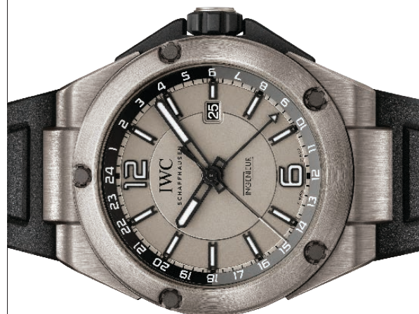
Ingenieur Dual Time Titanium Automático, 45 mm en titanio, correa en caucho negro y doble huso horario.