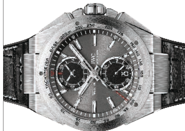
Ingenieur Chronograph Racer Automático, 45 mm en acero y correa en piel de caimán.

El español e iwc comparten más que una relación profesional: ambos tienen una técnica y personalidad sobresalientes. Aquí, los tres relojes de la sesión.