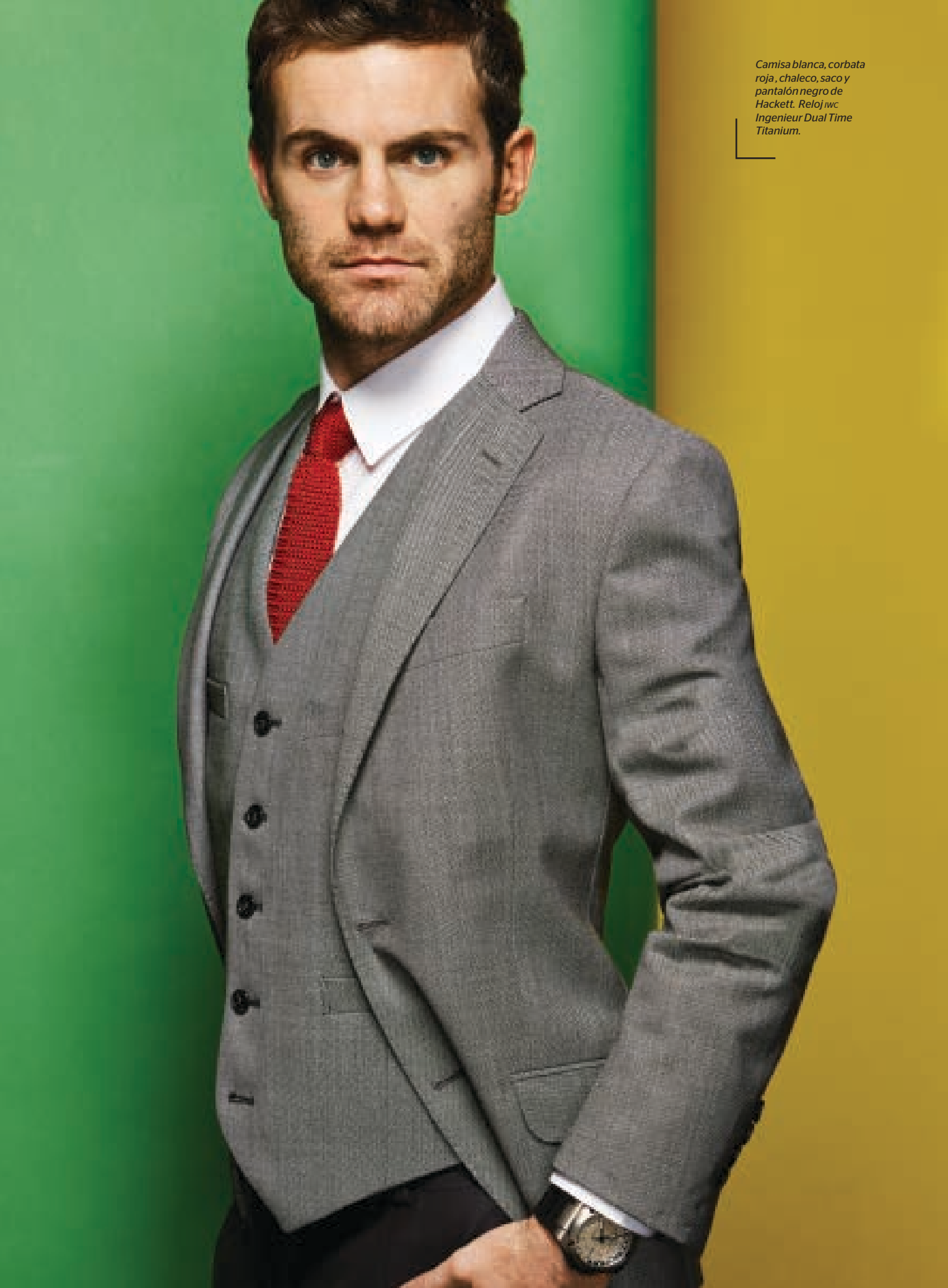
Camisa blanca, corbata roja, chaleco, saco y pantalón negro de Hackett. Reloj iwc Ingenieur Dual Time Titanium.